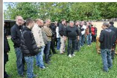
Soutěžící si na každém ze střeleckých stánků vyslechli poučení o bezpečnosti střelby a další pokyny k jejich průběhu.