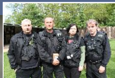
Pozvání na střeleckou soutěž přijali v letošním roce i zástupci Slovenské komory soukromé bezpečnosti (SKSB).

Jednotlivé disciplíny probíhaly současně na 3 střeleckých pozicích.