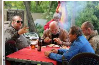
KPB ČR využila kapacit a možností střelnice ve Vražkově a zajistila soutěžícím i hostům vynikající speciality z místního grilu.