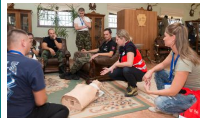
Členové zdravotní záchranné služby Falck při ukázce první pomoci. Byť sami při výkonu povolání zbraně nepoužívají, jako družstvo se soutěže také účastnili.