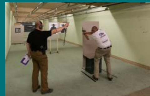
Dynamická střelba, tzv. parkur, prověřila rychlost a přesnost střelců při řešení modelové situace napadení objektu.