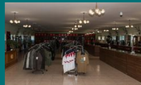
Prostory prodejny zbraní a střeliva, která je součástí střelnice.

Z pohledu účastníka musím konstatovat, že soutěž byla zorganizována precizně do posledního detailu, takže ani přes velký počet střelců nedocházelo k žádným dlouhým prodlevám nebo zmatkům. K pohodovému průběhu soutěže přispěla vedle organizace na vysoké profesionální úrovni i disciplinovanost účastníků soutěže.