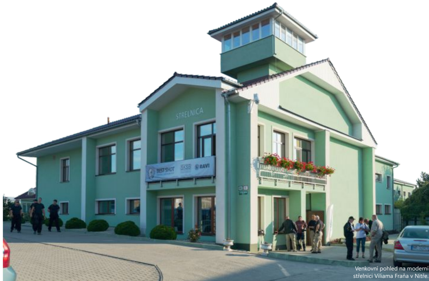
Venkovní pohled na moderní střelnici Viliama Fraňa v Nitre.

Dne 30. září 2016 se konal již 6. ročník střelecké soutěže družstev a jednotlivců BEST SHOT Central European Cup. Soutěž zorganizovala společnost RAVI s.r.o. pod záštitou Slovenskej komory súkromnej bezpečnosti. Soutěž se konala u našich slovenských sousedů – na střelnici Viliama Fraňa v Nitre.