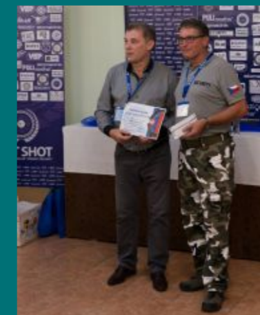
Druhou pistolí v soutěži, Grand Power P1 Mk7, si odnesl náhodně vylosovaný účastník soutěže.

Přátelskou atmosféru a dobrou náladu podpořili organizátoři i bohatým občerstvením. Přihlížejícím divákům demonstrovali přítomní členové zdravotní záchranné služby Falck základy první pomoci. Velkému zájmu se těšila rovněž prodejna zbraní a střeliva, která je součástí areálu střelnice. Celkově působí celý komplex velmi příjemně a jeho vybavení je na velmi vysoké úrovni.