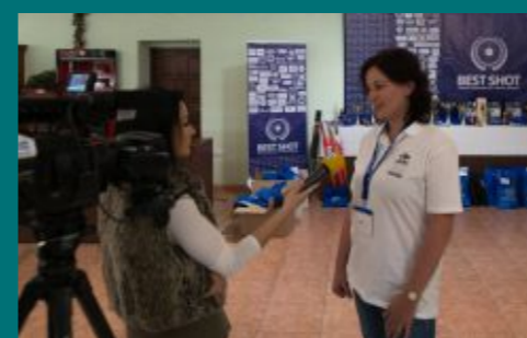
Na soutěži byly přítomni i reportéři ze dvou slovenských televízi. Zde je tajemnice KPKB ČR při rozhovoru pro televizi Nitra.