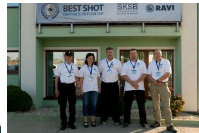
Střelci z řad členských firem, kteří reprezentovali KPKB ČR.