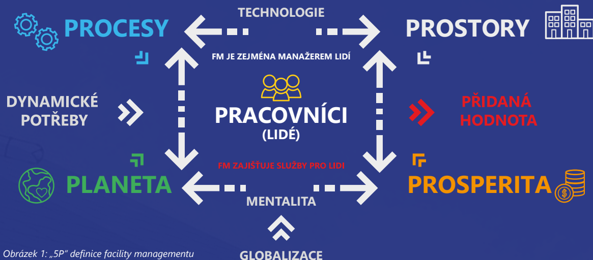
Obrázek 1: „5P“ definice facility managementu

a dodnes stěžejní komponent facility managementu, kterým je pracoviště (kancelář, dílna, pole atd.). Facility manažer má zařídít a nastavit takové pracovní prostředí, které je vyhovující jak provozně, bezpečnostně, zdravotně a hygienicky, tak i esteticky, sociálně a psychologicky. Pracoviště musí podporovat efektivitu práce a tím zvyšovat produktivitu organizace. „Planeta“ zde symbolizuje udržitelnost, tj. ekologické aspekty pracovního prostředí (obecně jakéhokoli prostředí, o které se facility manažer stará – sportoviště, rekreační prostory apod.). Pojem „Prosperita“ (někdy též „Peníze“) určuje ekonomické mantinely facility manažera. Ten musí vždy vnímat, že ať použije jakékoli prostředky, musí tyto vždy vést ke konečné přidané hodnotě organizace jako celku.